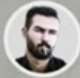
نەھەم بەحيا جەمەمال