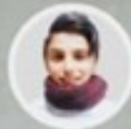
ھەرىم عەلى سەيدسالىق