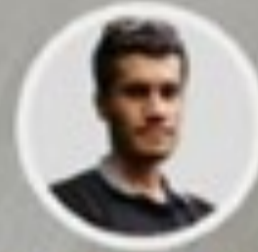
ناكو سەلمان كفرى