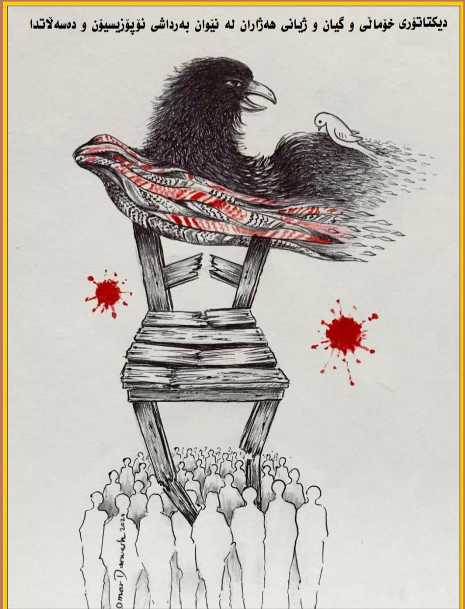
دىكتاتورى خۇماتى و گيان و ژيانى ھەژاران لە نىوان بەرداشى ئۇپۇزىسيون و دەسەلاتدا