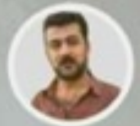
ناوات تالىب بىنچوڭ

ئەو وینانەى دەيان بىن، قوربانىانى دەستى ھىزەكانى حزیه كانى بزووتنەو كوردايەتىن. ئەو لاو و تازە لاوانە كە لە خۆپېشاندا كەندا بوونە قوربانى، ئەو ئىنسانە دلېر لە ھىوا و نارمزانە بوون، كە دەیانویست ھىچى تر خەلكى بېبەشى كوردستان نەبەنە قوربانى دەسەلاتى چاۋچنۇكى سەرمایە سەرمایەداران. دەیانویست موچە و نان و نازادى و ئىيانكى شكۆمەندانەيان ھەبىت، كەچى بەدەستى چەكدارەكانى حزیه كانى پارىزەرى سەرمایە، كرانە قوربانى و بەشپۆيەكى زۇر دېندانە گىيانىان لى سەندراپەو.