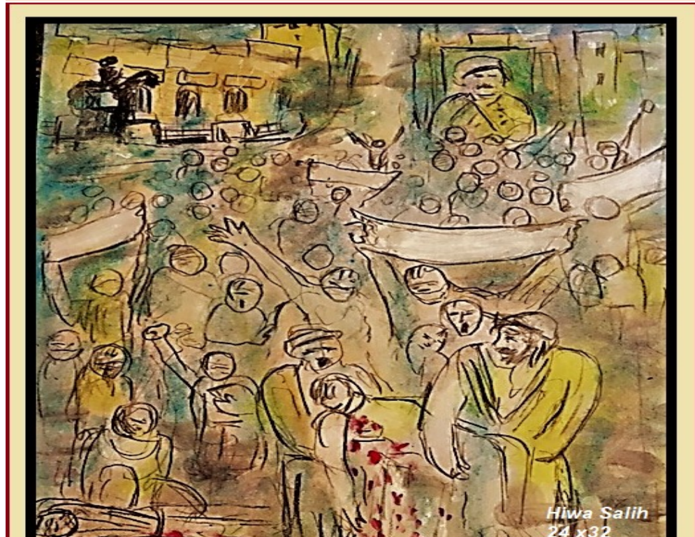
بەرھەمى ھونەرەندە ھىوا سالىح

چەندە خۇش دەبوو لەبەر ئاوينەدا قەسەم لەگەل خۇم دەكردو