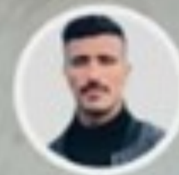
سەرىسەت عوسمان دەرىسەندىپشان