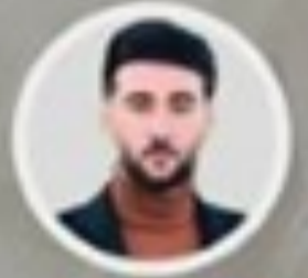
ھىوا فواد تەكە